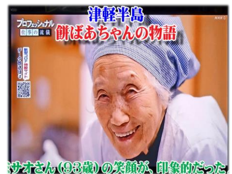
サオさん(93歳)の笑顔が、印象的だった