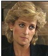
ダイアナ妃 人は社会が求める ような完璧な人になろうとすると、 息が詰まってしまう