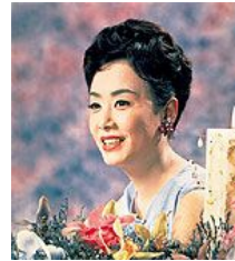
美空ひばり 、 ひたすら人の山を登る 最後の4ヶ月、やっと 加藤かずえになる