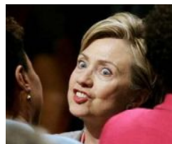
他人の山を登る: Hillary Clinton

37歳のときに脳梗塞 左脳がマヒ、お陰で右脳 の世界、Nirvana(涅槃) を体験する