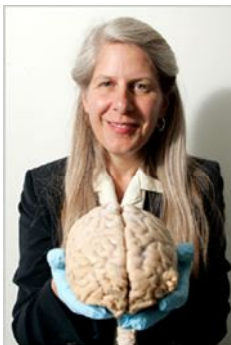
Dr. Jill Bolte Taylor 脳神経学者

37歳のときに脳梗塞 左脳がマヒ、お陰で右脳 の世界、Nirvana(涅槃) を体験する