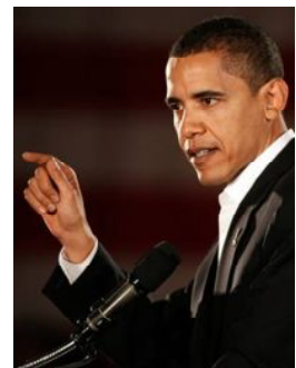
Barack Obama A Man Of Integrity 自分の山を登る