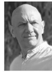
Bernie Siegel, M.D.