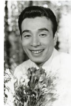
植木等 享年 80 歳

ブディズムとは、心を解放するための知恵である キリスト教などの他の宗教は、戒律を重んじて生きる 約束ごとである