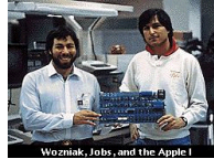
Wozniak, Jobs, and the Apple I