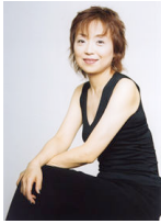
シャンソン歌手クミコ